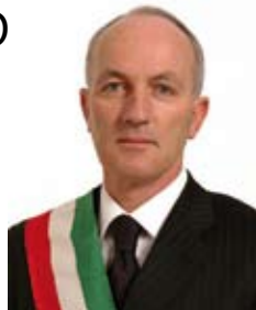
di Sergio Zappalorto*

La nostra Amministrazione ha avuto e continuerà ad avere sempre di più la necessità di sviluppare un rapporto diretto e costruttivo di confronto e collaborazione con i cittadini. In particolar modo, noi amministratori consideriamo questa condizione di prossimità alla comunità