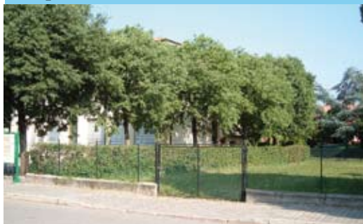
L'area acquistata per l'ampliamento delle elementari

Obiettivo dell'Amministrazione è di esaurire gli adempimenti burocratici, gara di appalto compresa entro l'anno.